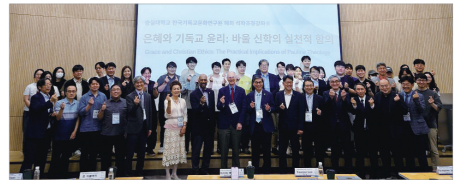
행사 관계자들이 단체사진 촬영에 임하고 있다.

그러나 바클레이 교수는 "바울이 고린도후서에서 연보의 풍성함을 표현할 때 사용한 단어는 액수나 양적인 개념이 아니라 '하플로테스(Haplotēs)'였다"며 "이는 선물이 가진 '순전함'과 '단일한 마음(Single-heartedness)'을 뜻하며, 돈의 액수로 측량할 수 없는 영적인 관대함"이