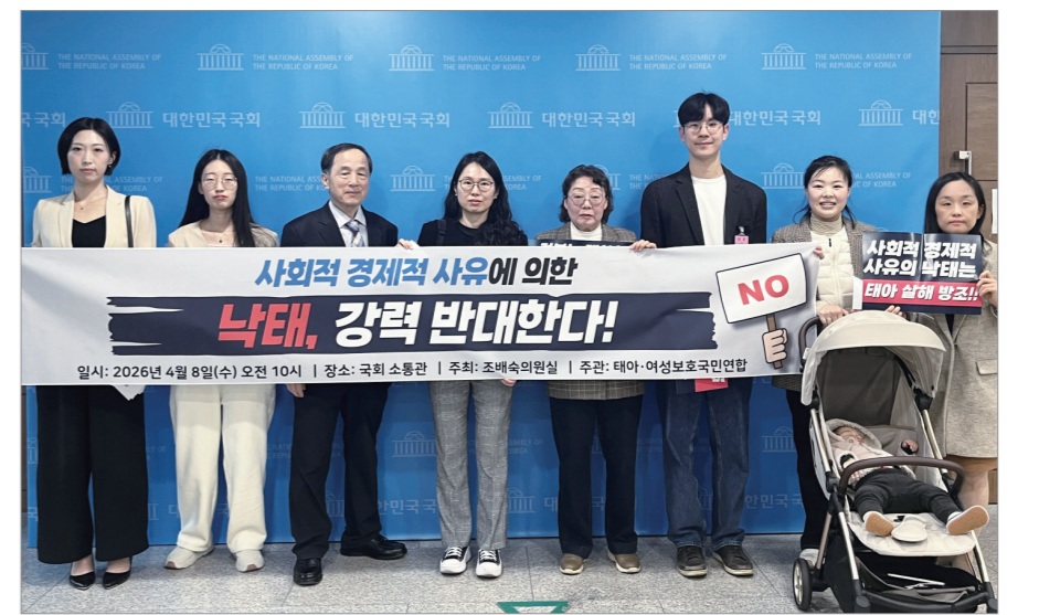
태아-여성보호국민연합 기자회견에 참석한 발원자들이 8일 서울 여의도 국회소통관에서 기념촬영을 하고 있다.

현장에 참석한 한 산모(두 아이의 엄마)는 "생명의 가치는 조건에 따라 달라질 수 없으며, 가장 약한 존재를 보호하는 것이 공동체의 기본 원칙"이라며 "낙